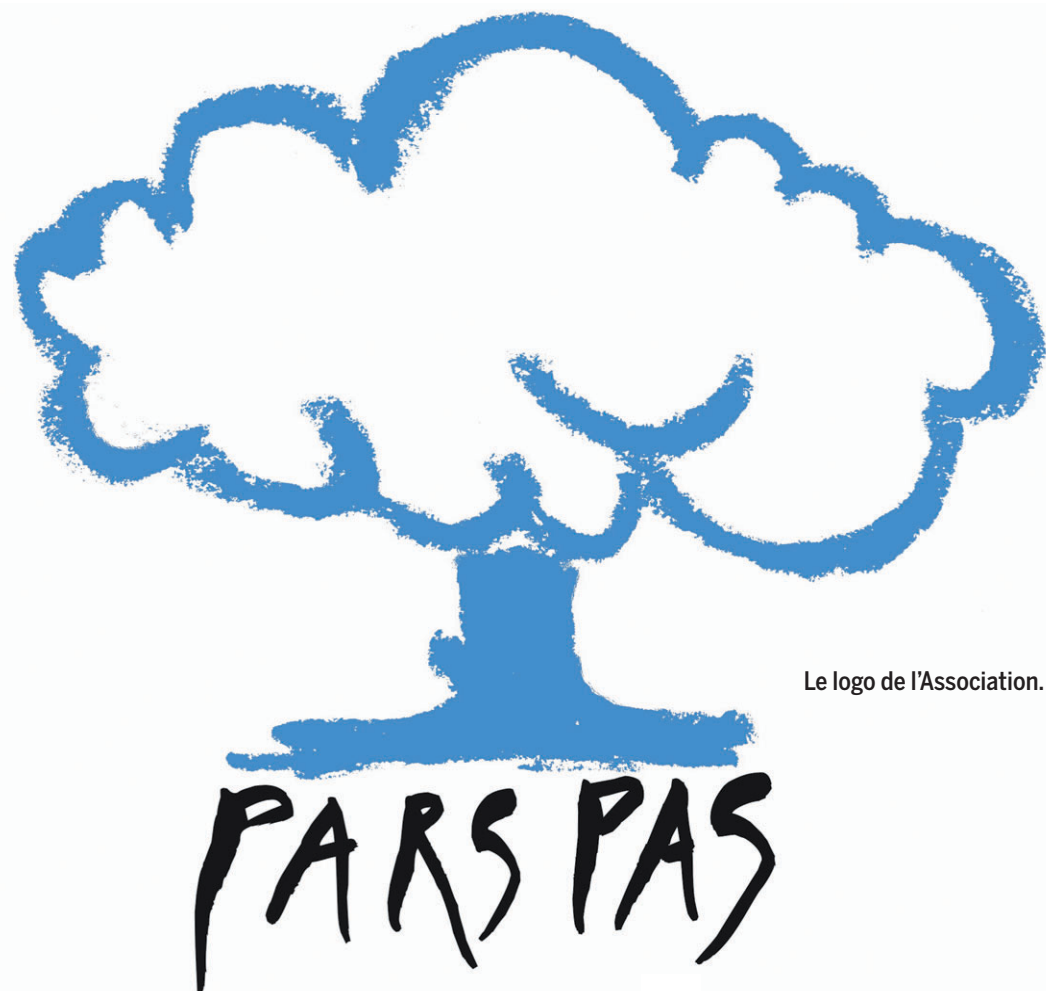
Le logo de l'Association.

a tout perdu ou presque: sa femme d'abord, son fils ensuite, engagés dans cette voie sans issue.